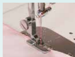
Søm (hemming) Trykfod