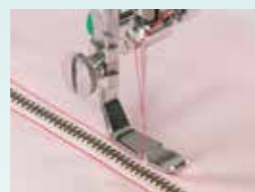
Trykfod Til Fastgørelse af Lynlås