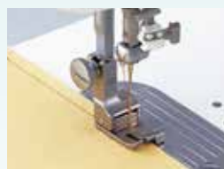
- Kompenserende Trykfod (højre 6,5mm) - Kompenserende Trykfod (højre 7mm)